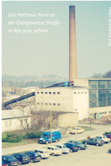
Das Heizhaus Nord an der Georgewitzer Straße in den 90er Jahren

Der Schwerpunkt Wärmeversorgung ist auf die Historie der Stadt in den Jahren der DDR zurückzuführen. Damals war Löbau Garnisonsstadt und beherbergte die Offiziersschule der Landstreitkräfte der NVA. Für die hohe Zahl an zugezogenen Berufssoldaten mussten neue Wohnungen, meist in industrieller Bauweise, entstehen. Es stellte sich schnell heraus, dass eine zentrale Wärmeversorgung die effektivste Lösung für diese Neubauwohnungen darstellte. Mit der Errichtung des Wohngebietes Löbau Nord – dem zweiten Neubaugebiet der Stadt – wurde die Fernwärmeversorgung in Löbau eingeführt und von der VEB Gebäudewirtschaft Löbau betrieben. Der Dampf wurde von dem bereits bestehenden Braunkohle-Heizwerk